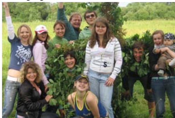
Trots en blöt och regnig midsommar tycks det som om festdeltagarna uppskattat tilldragelsen där de poserar runt majstången.

medlemmar och vänner skyggade för. Det var sjätte året i följd som Kulturkompaniet ordnade Svensk Midsommar i Gwardejsk. I år, liksom i fjol avhölls festen på "Guds Gröna Ängar" andra sidan floden med staden som sagolik fond. Här kläddes och restes majstången och trots det ihållande regnet både sjöngs och dansades det. "Små grodorna", "Björnen sover" och "Skära, skära havre" varvades med Matjessill, köttbullar, nypotatis och Halländsk Fläder. I år fanns tyvärr ingen representant från Svenska Generalkonsulatet med på högtidsplatsen men tilldragelsen samlade ändå ett tjugofemtal festglada. Kanske var det just regnet som framkallade känslan av gemenskap och värme mellan de närvarande, ty ingen klagade på vädret. Framåt kvällen sprack också molnen upp och begåvade sällskapet med en fantastisk solnedgång.