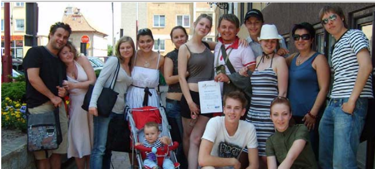
Delar av gänget som framförde "Don't destroy our love by war!" på torget i Olsztynek. Snart är det avsked och man vet inte när det blir tillfälle att träffas igen...