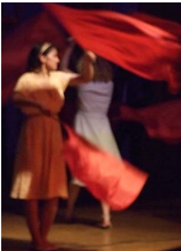
Det gemensamma flaggspelet repeteras innan föreställningen i Gwardejsk.