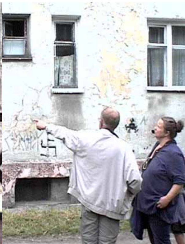
Familjen Schackunart besöker morfaderns hembygd i Kaliningrad/Königsberg «Här bodde jag en gång i tiden...»