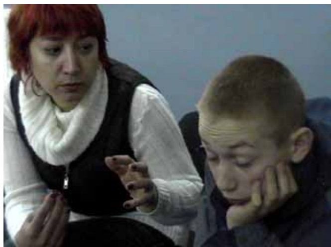
TACIS-möten i Pionerskij och Svetlogorsk