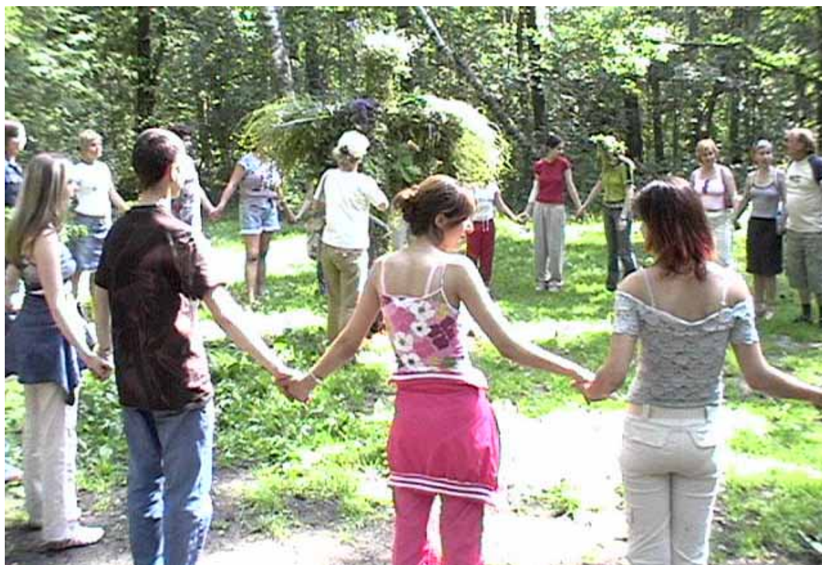
Traditionellt svenskt midsommarfirande. För fjärde året i rad firar Kronor & Nycklar midsommar med vänner och partners. Här ringlekar runt Majstången

Månaden ut hände så inget särskilt på verksamhetsfronten.