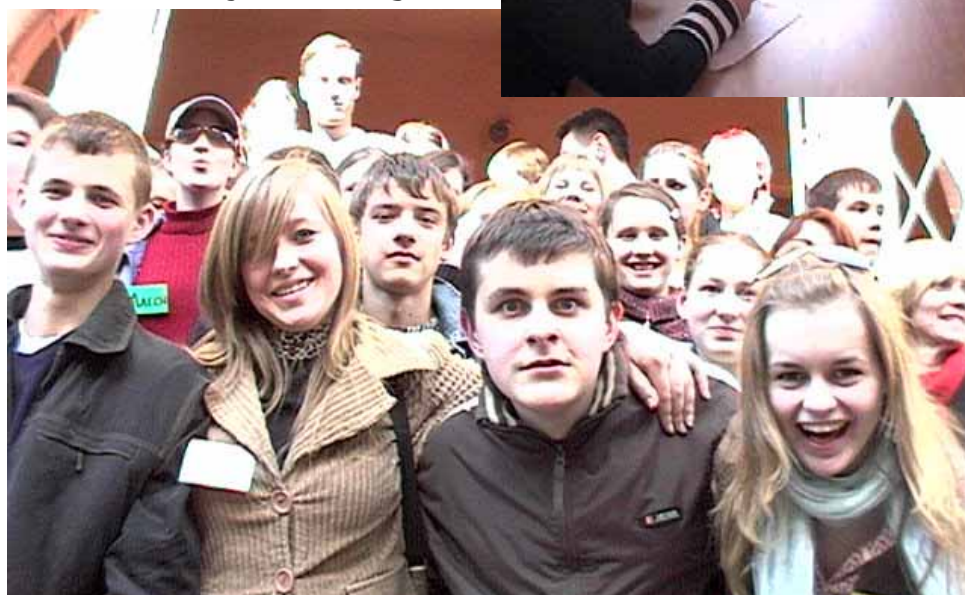
Ungdomar från Pionerskij, Svetlogorsk och Gvardejsk möttes den 14 maj i Gvardejsk inom ramen för TACIS-projektet «Sanning & Konsekvens»