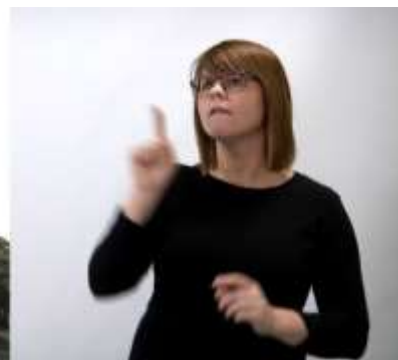
Filmen textad och teckenspråkstolkad