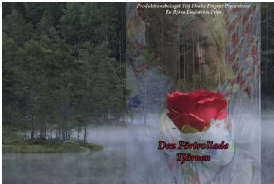
Den förtrollade Tjärnen – En del av filmen "Mer Än Du Ser"